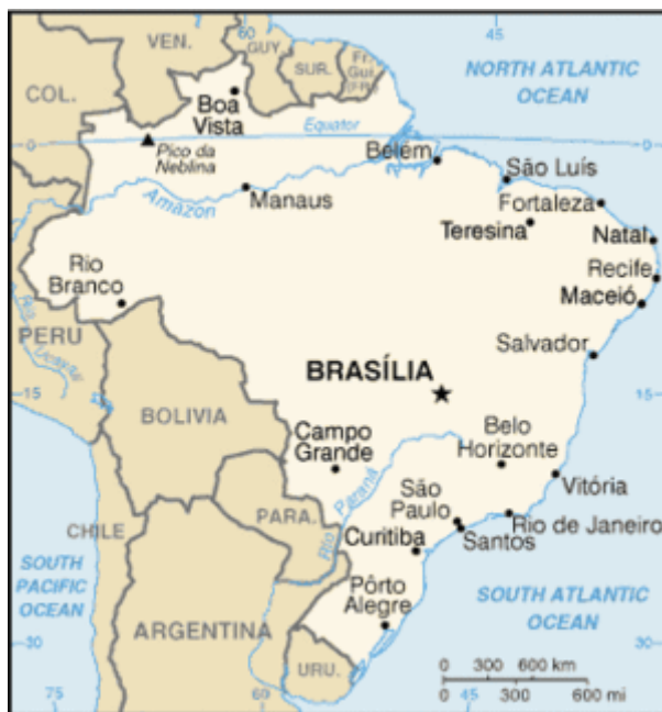
Mapa administrativo de Brasil

Los principales partidos políticos son el PMDB (Partido do Movimento Democrático Brasileiro), con 107 diputados en el Congreso; el PFL (Partido da Frente Liberal), con 89 diputados; el PSDB (Partido da Social Democracia Brasileira), con 62 diputados; el PPR (Partido Progressista Reformador), con 52 diputados; el PT (Partido dos Trabalhadores), con 52 diputados; y otros minoritarios como el PP, PTB y PDT.