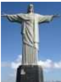
Río de Janeiro

La región Sudeste, compuesta por los estados de Minas Gerais, São Paulo, Rio de Janeiro y Espírito Santo, comprende en las regiones más altas, un clima tropical agradable, con las cuatro estaciones bien definidas. Ya en el oeste y noroeste del estado de São Paulo y en el Triângulo Mineiro predomina el tiempo tropical semi-húmedo semejante al clima serrano del centro-oeste.