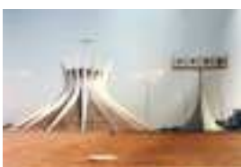
La capital, Brasilia

El gobierno de Lula, que comenzó con una serie de programas sociales radicales a principios del 2003, tuvo que reducir presupuestos en seguida. Su objetivo principal ha sido el costoso sistema de pensiones nacional, que actualmente está siendo revisado.